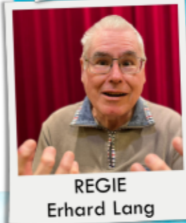
REGIE Erhard Lang